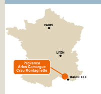
Provence Sites Camargues Cava Biosphère